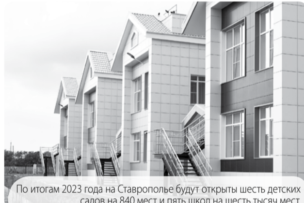
По итогам 2023 года на Ставрополье будут открыты шесть детских садов на 840 мест и пять школ на шесть тысяч мест.

Губернатор осмотрел помещения, обсудил с родителями и воспитателями их