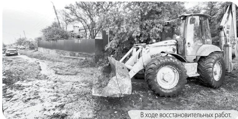
В ходе восстановительных работ.

Р.С. К сожалению, стихия напомнила о себе вновь и на минувших выходных. Как сообщил ТГ-канал главы Предгорья, ночью в хуторе Хорошевский дамба была переполнена и находилась в критическом состоянии. Сейчас она работает в штатном режиме.