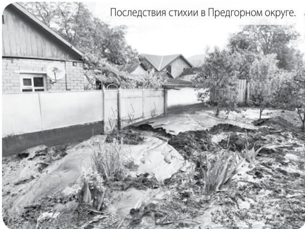
Последствия стихии в Предгорном округе.

В Единую диспетчерскую службу округа за неделю поступило порядка 80 вызовов от жителей. В устранении последствий непогоды на местах работали полтора десятка спасателей. По прогнозу, прекращение дождей следует ожидать к 7 июня, однако угроза подтопления населённых пунктов сохраняется, так как в почве переизбыток влаги, земля её уже не впитывает и при усилении осадков вода с полей снова может пойти в населённые пункты Предгорья.