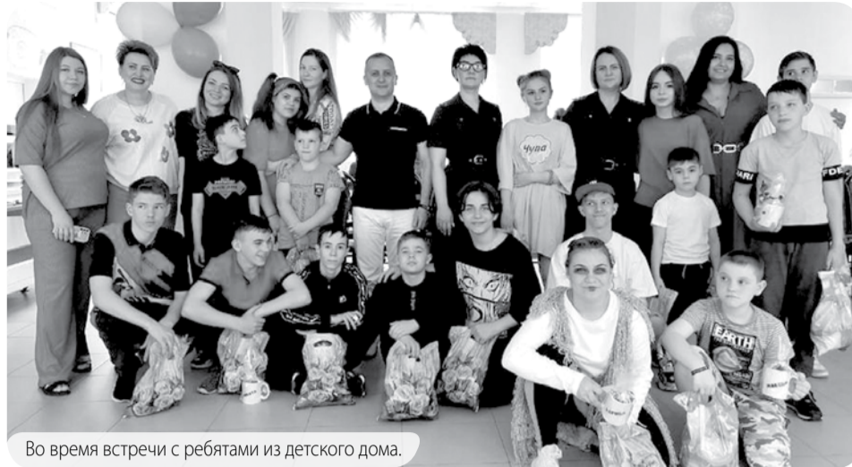
Во время встречи с ребятами из детского дома.

Каждому ребёнку сотрудники отдела уделили внимание, дети поделились своими секретами, рассказали о планах на лето. Сотрудники СКР приня-